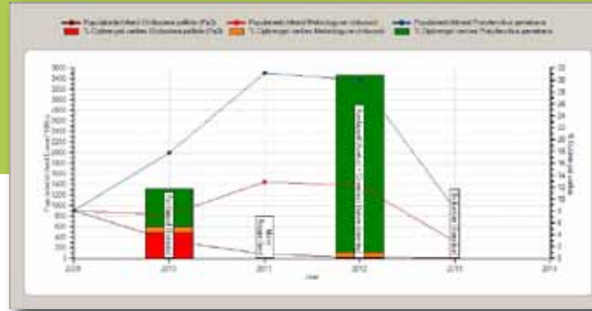
Populatieontwikkeling van drie aaltjessoorten onder verschillende gewassen en bij toepassing van granulaat in de aardappelteelt

NemaDecide bevat bovendien zeer uitgebreide informatie over vrijwel alle, in Nederland geteelde, aardappellassen (ruim 400 rassen). Er kan eenvoudig een selectie worden gemaakt op basis van handelshuis en/of op basis van raseigenschappen.